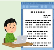
受診票 保健センターHPよりA4サイズで印刷し、記入して持参